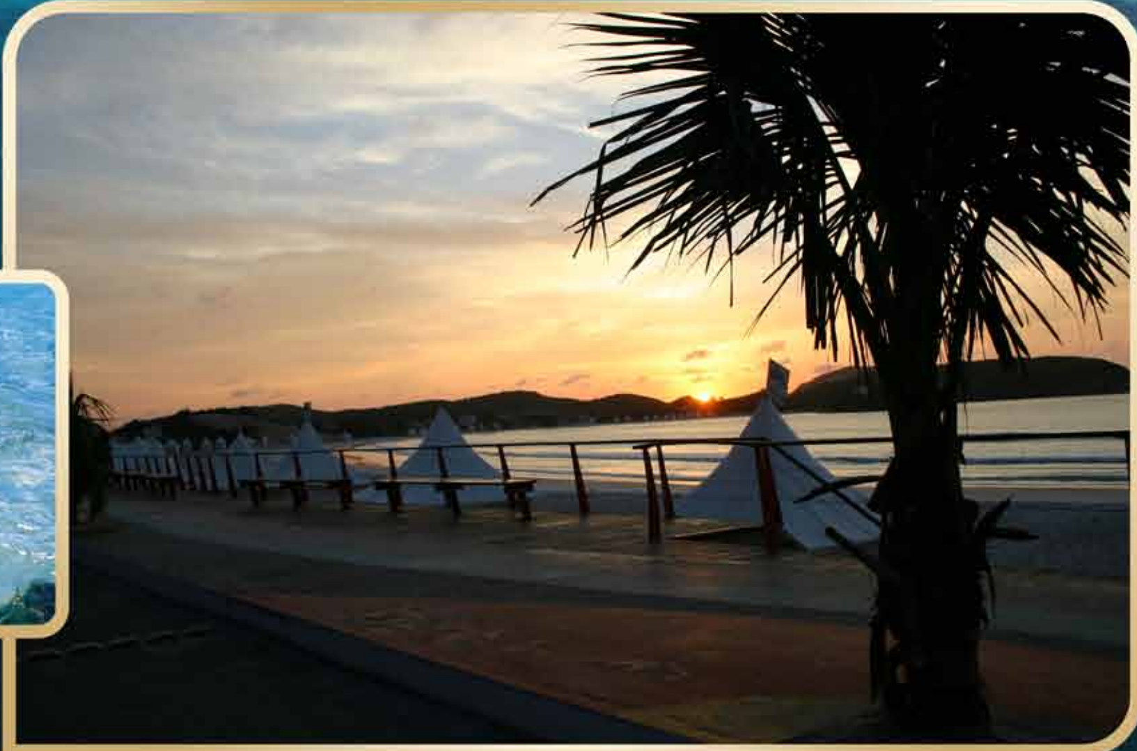
Praia do Forte - Cabo Frio