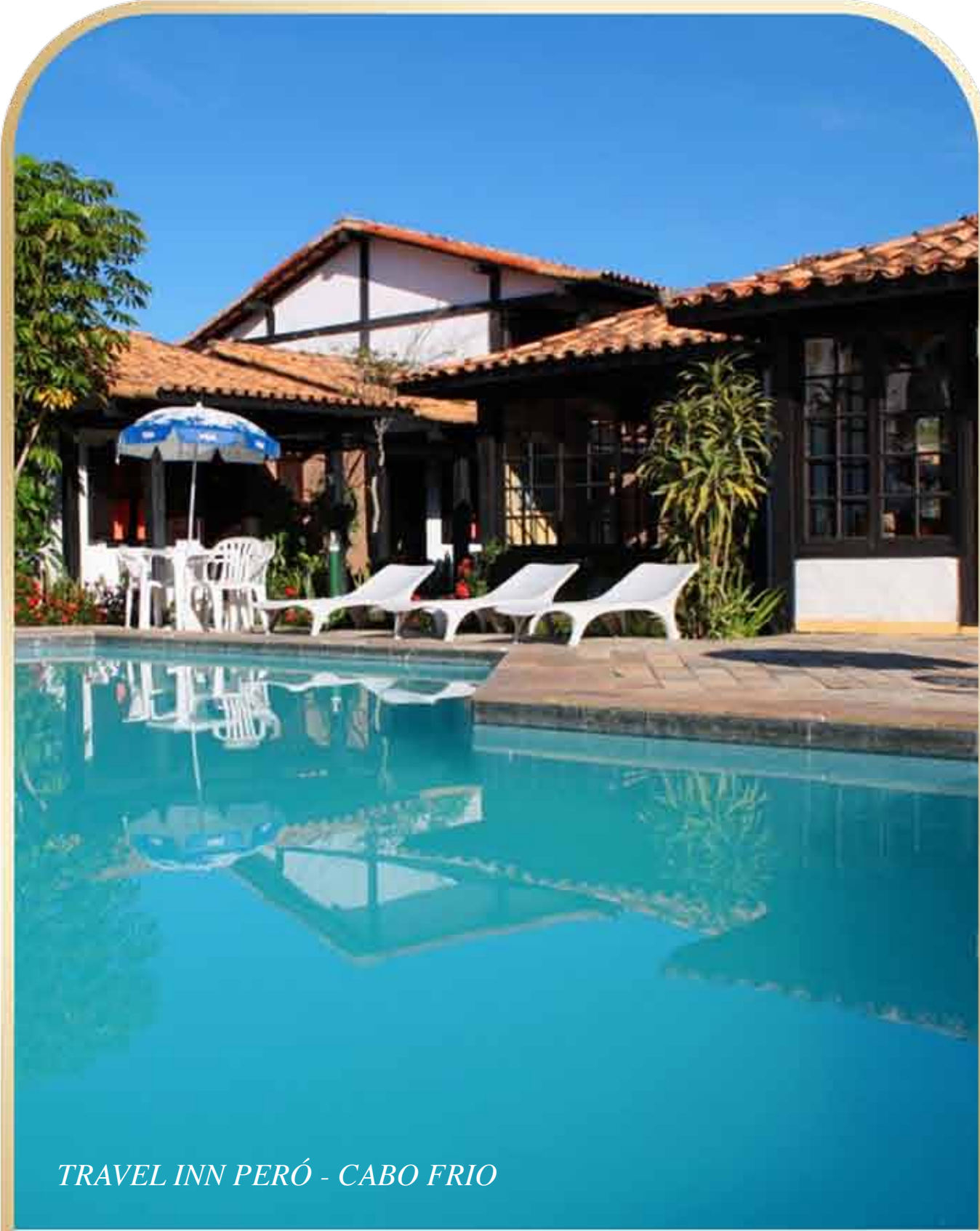
TRAVEL INN PERÓ - CABO FRIO