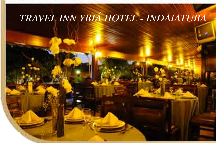
TRAVEL INN YBIÁ HOTEL - INDAIATUBA