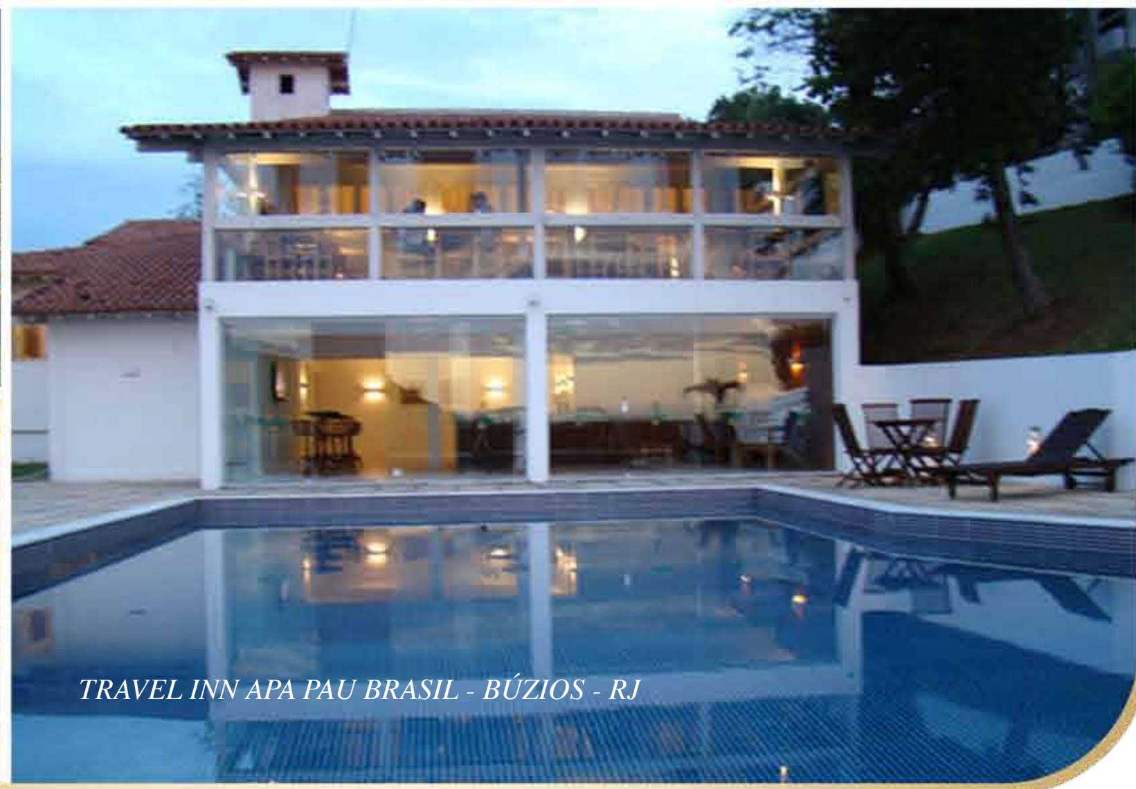
TRAVEL INN APA PAU BRASIL - BÚZIOS - RJ