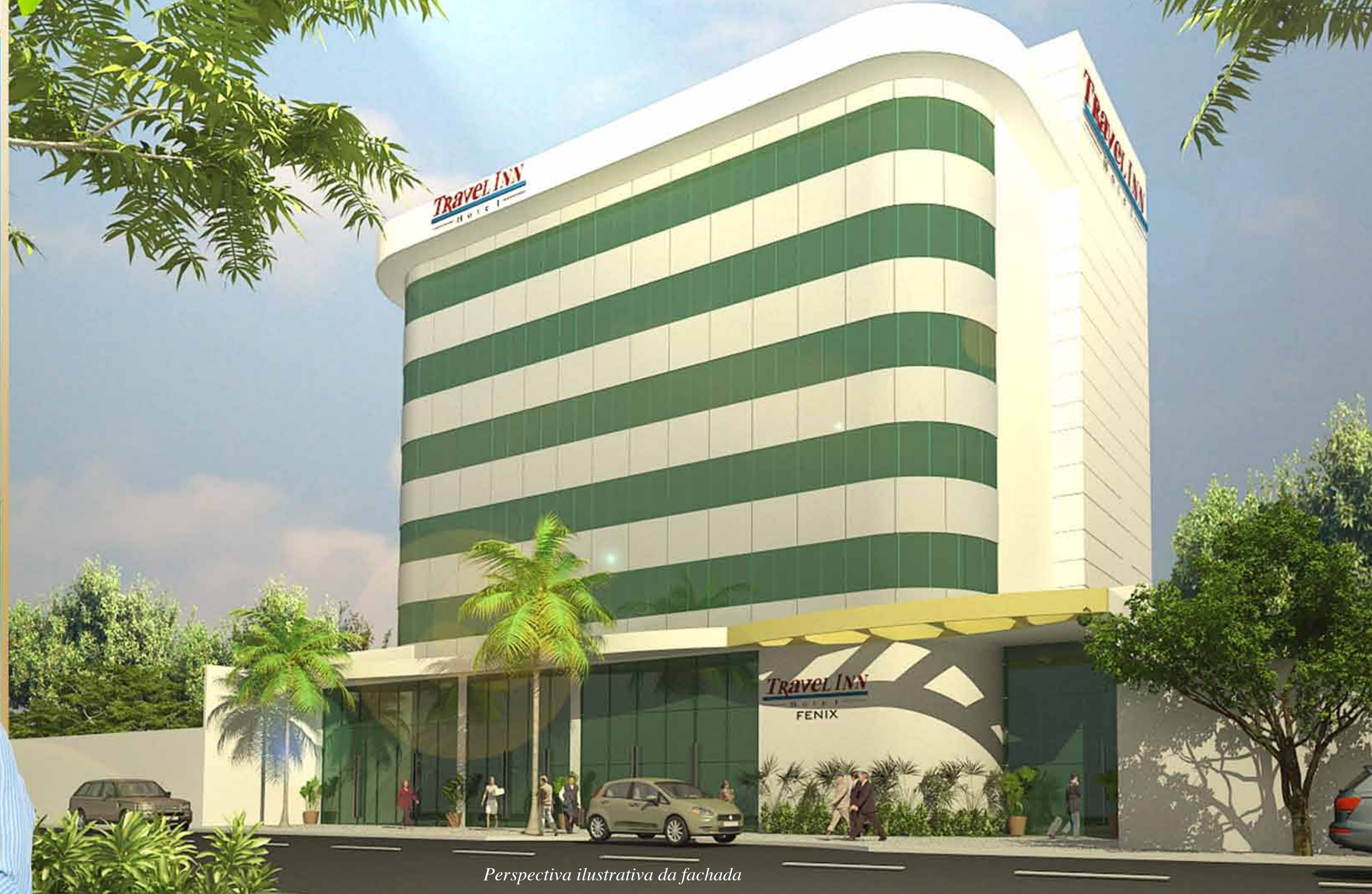
Perspectiva ilustrativa da fachada

Totalmente planejado para que todos os investidores cotistas possam ter a certeza de que estão investindo em um porto seguro, onde cada hóspede poderá usufruir de momentos inesquecíveis e compartilhar a sua satisfação com toda sua rede de contatos, multiplicando assim nossa marca maior, a satisfação total do cliente.