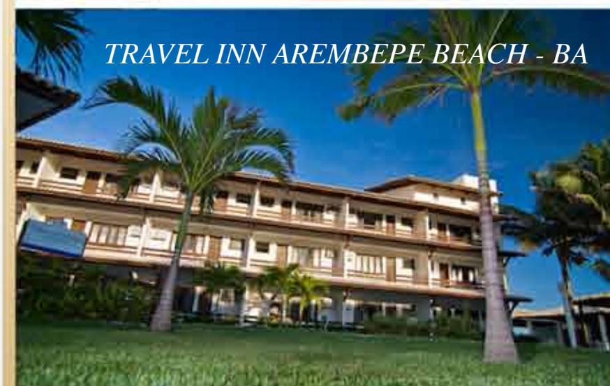
TRAVEL INN AREMBEPE BEACH - BA