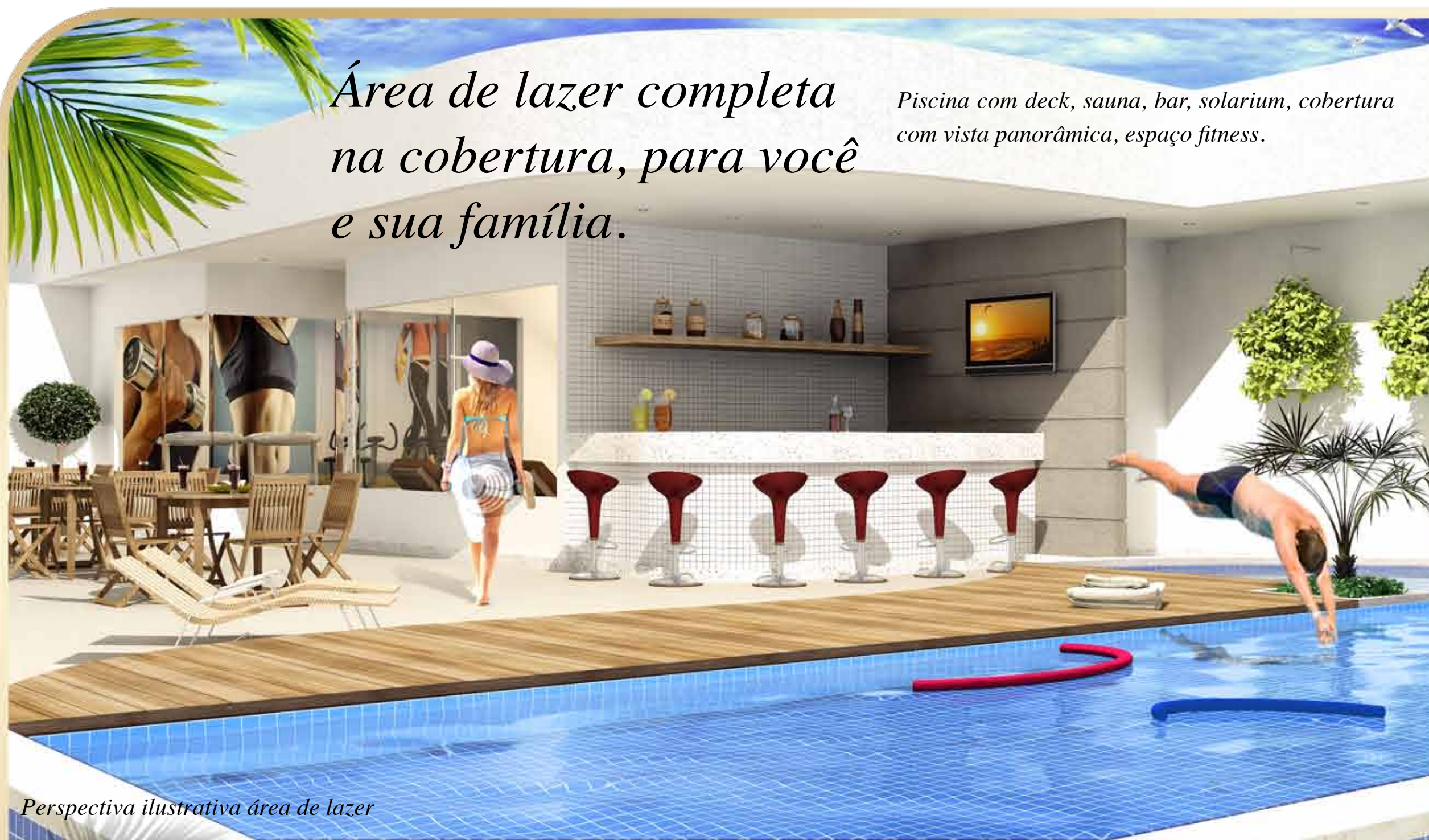
Perspectiva ilustrativa área de lazer

Piscina com deck, sauna, bar, solarium, cobertura com vista panorâmica, espaço fitness.