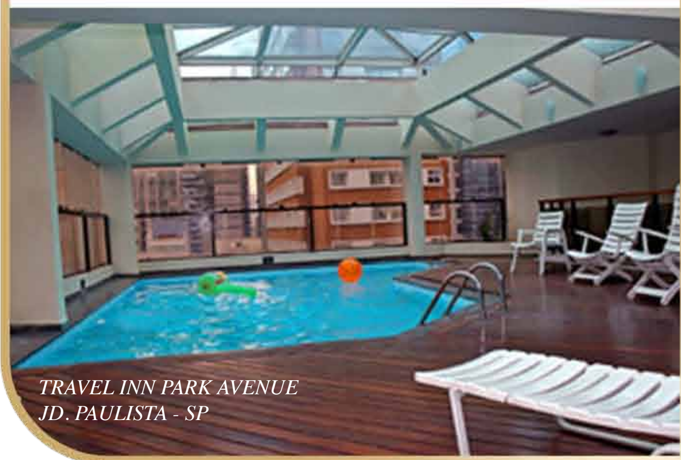
TRAVEL INN PARK AVENUE JD. PAULISTA - SP