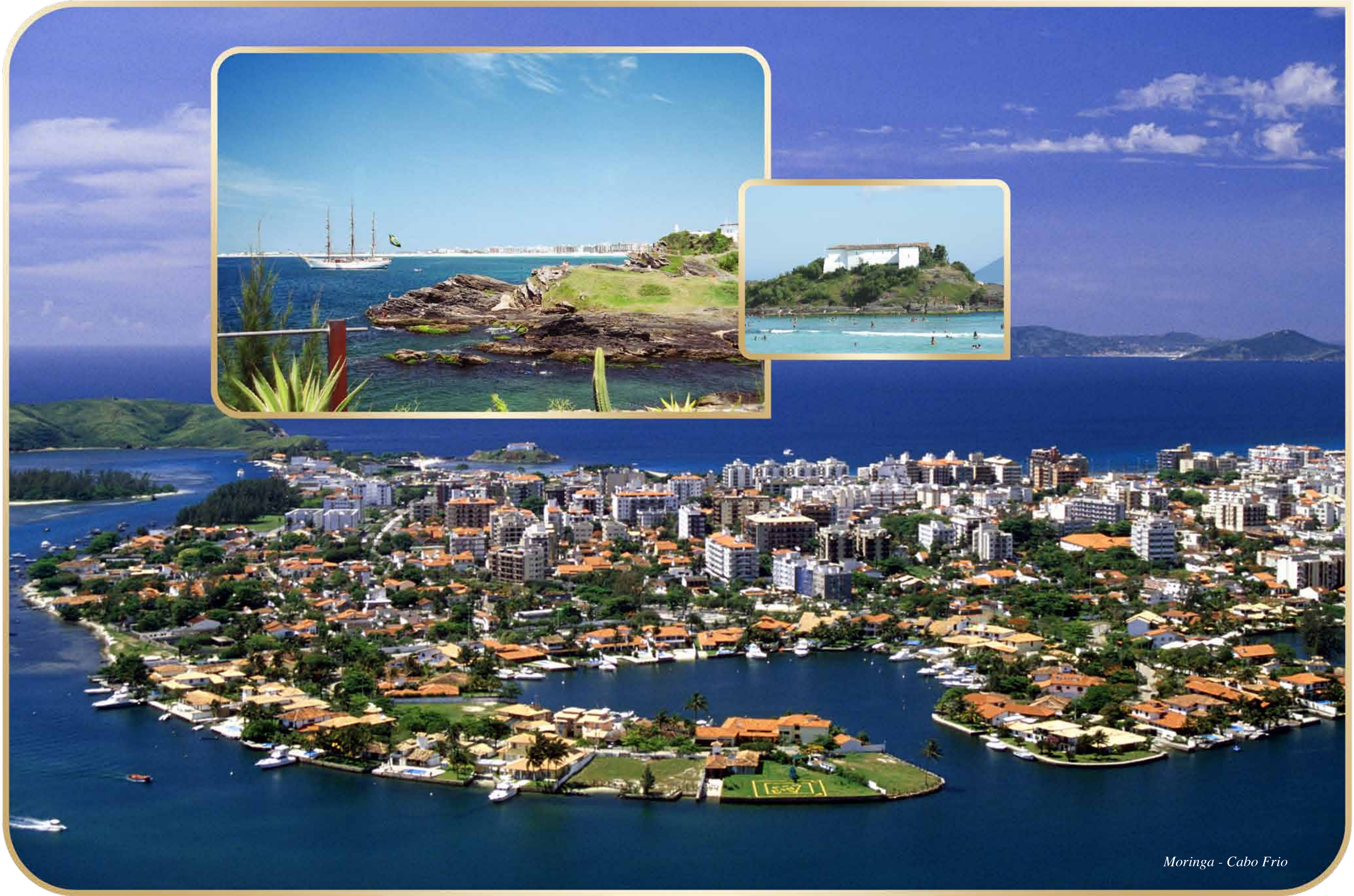
Moringa - Cabo Frio