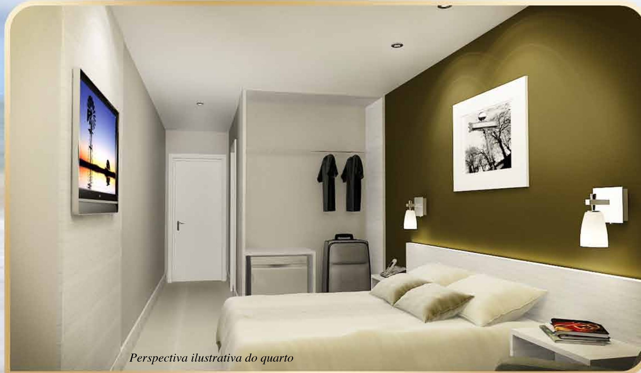
Perspectiva ilustrativa do quarto

Praticidade, sofisticação e um toque de requinte.